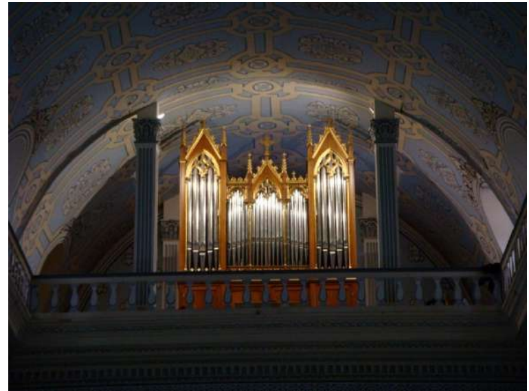
Figura. Órgano del templo de San Felipe Neri (Pasto, Colombia), construido por la casa Van Bever (ca. 1899), emplazado actualmente en el coro alto.

The core of the study focuses on the organ's troubled journey, which was interrupted by the Thousand Days' War (1899–1902). This conflict prevented its disembarkation and led to repeated detours and prolonged storage. Finally, the paper examines the installation, inauguration, and subsequent relocations of the instrument, as well as its restoration in the early twenty-first century. It concludes that the organ of San Felipe Neri constitutes a paradigmatic example of a displaced cultural object that, once inserted into a space marked by ideological and political borders, acquired new meanings beyond its musical function.