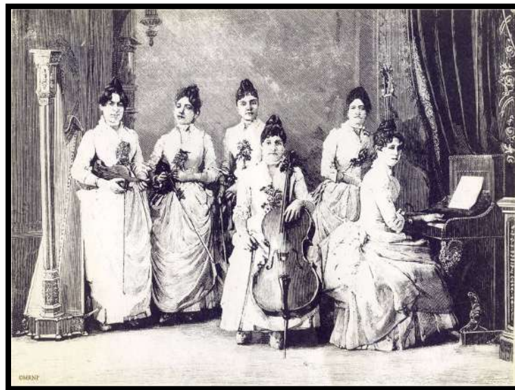
Figura. Ramiro Franco. Sexteto de señoritas organizado por el Maestro D. Agustín M. Lerate. [Sevilla], 1888. Edición digital propia a partir de litografía

under the auspices of public policies, is unprecedented in Spain. His work and personal interest in the harp facilitated the instrument's professional development in this country, and it is here that the contributions to his biography are focused.