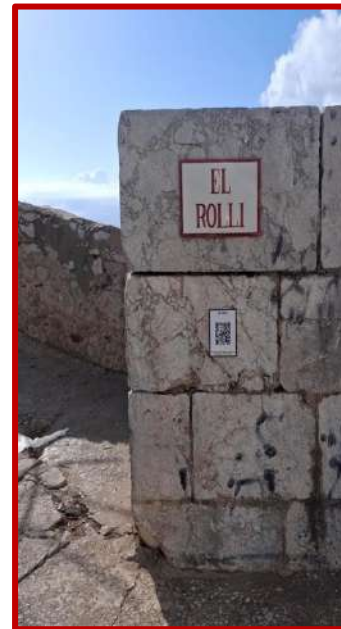
Figura. Imagen representativa del proyecto para la difusión del patrimonio gibraltareño en alusión en su memoria histórica.

In Gibraltar, heritage fulfils three key functions: safeguarding both tangible and intangible culture, serving as an informal educational system, and reinforcing cultural pride. Far from being ornamental, the heritage policy in Gibraltar is a vehicle for collective memory, public identity, and social cohesion. It embodies a strategic cultural turn where historical justice and self-representation are central to urban and political development.