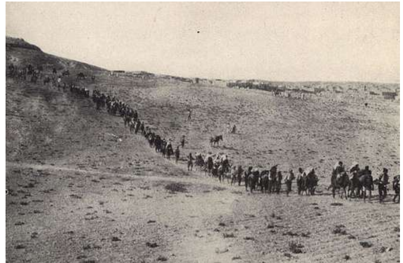
Figura. Caravana de refugiados griegos (1923)