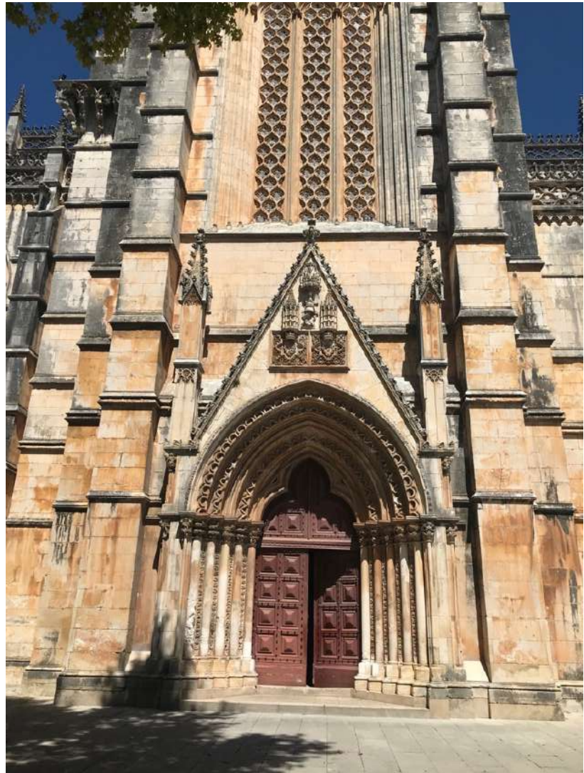
Figura. Portal Sur del Monasterio de Batalha en 2023. Imagen del autor