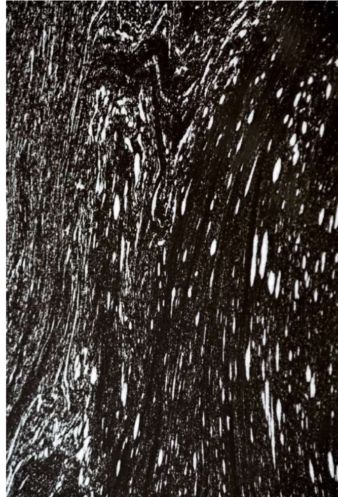
Figura. Sin título. Autor: Jorge Peñaranda Alvarez

My proposal is to highlight the configuration of a border geopoetics in the sense that these texts link issues related to cultural translation, migration, and a diverse understanding of what is meant by “foreign” or “alien,” while also problematizing certain considerations about genres and literary practices originating in Western culture. Therefore, this paper will reflect not only on the idea of a border, but will also explore the aesthetic projections of the materials that inspire it. Jiwasá (Espejo, 2022), in turn, allows us to celebrate the exchange and constitution of a creative, poetic power that not only bursts onto the Latin American literary scene, but also challenges and questions long-established forms of reading, distribution, and even editing of literary texts. On this occasion, it is worth considering that borders are there to be reflected upon, crossed, and to question the order imposed on us. An order that can only be displaced through transgression and the creativity put into it.