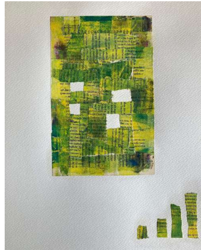
Figura. Sin título. Serie Archipiélagos. Collage. Autora: Micaela van Muylem

The border is therefore defined as a space of heterogeneity, flexibility, and permeability. Diversity must be understood as a space for dialogue, an instrument for building bridges of connection, never as borders of marginalization, exclusion, and vulnerability. We therefore wish to raise a complex issue that has multiple causes and possible solutions, and which requires interconnection between the academic world and the community in order to address it, understand it, and establish channels for decoding it. We are interested in working to identify the reality constructed by the migratory processes themselves, their difficulties, the strategies of resilience and survival they create, their purposes, and their results in order to understand migration as a process of change in both sending and receiving societies. In this sense, we are particularly interested in stating diversity as an added value of cultural and social wealth that highlights cultural diversities. And finally, we seek to distinguish the mechanisms of exclusion, segmentation, and discrimination—in historical, anthropological, linguistic, legal, and social terms—in order to build more inclusive realities. For this study, we will reflect on a series of experiences narrated by Latin American migrant women living in Seville.