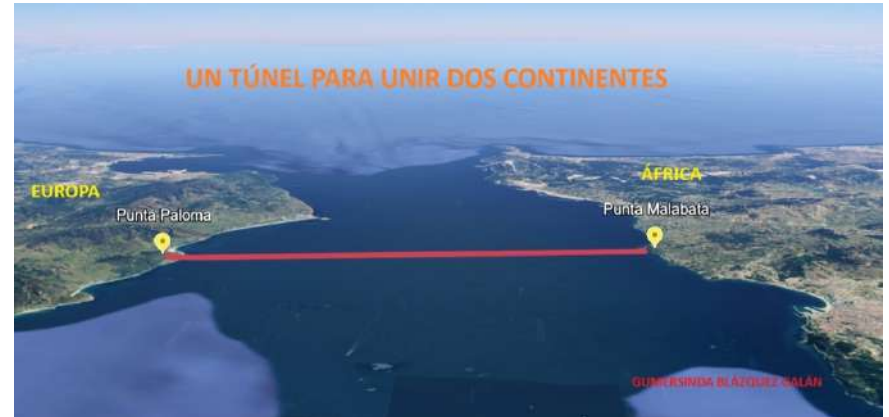
Figura. Infografía representativa de los territorios unidos en el proyecto de túnel que se analiza. Imagen de la autora

In recent years, it seems that the idea of the Tunnel has materialized into a feasible project, thanks to technical advances and the financial collaboration of the European Union along with the common interests of Spain and Morocco. There is even talk of realization phases and deadlines, of advantages and benefits that would surpass the high cost, and the 2040s are envisioned as the time when it could become a reality.