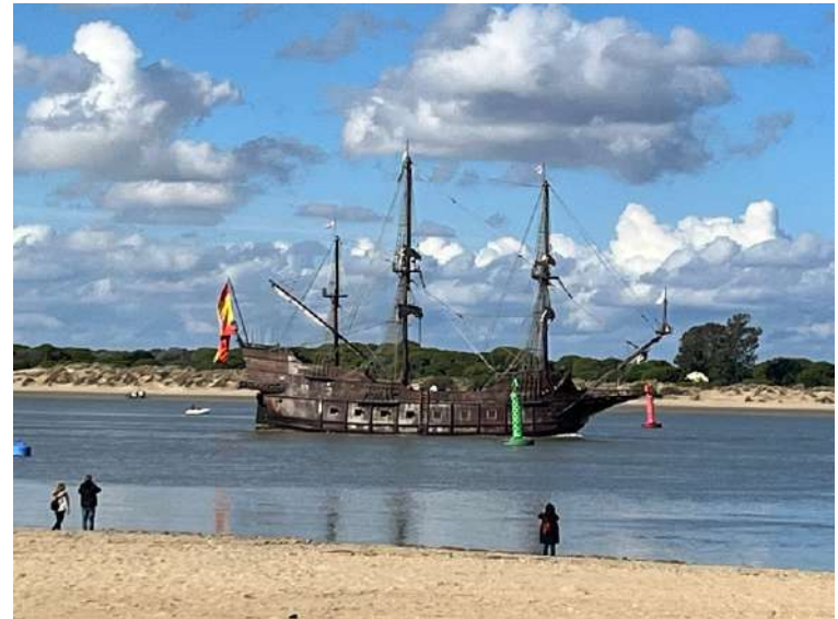
Figura. Embarcación. Imagen del autor

consolidation of their state structures have found in the aquatic environment both a passive defense mechanism, a barrier, and a means of active interaction, communication, and expansion.