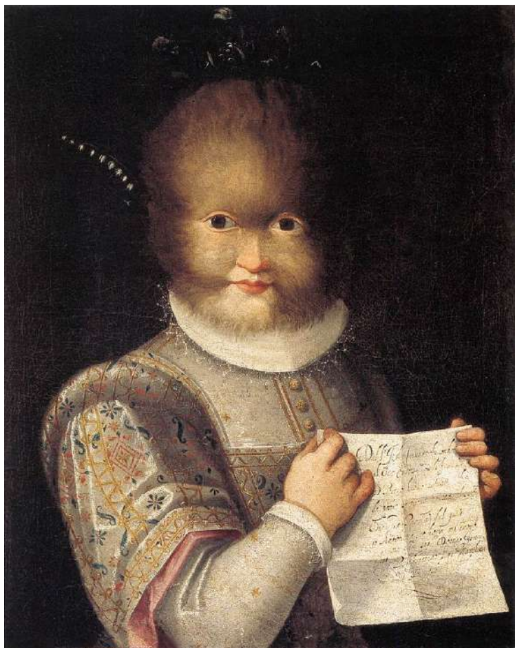
Figura. Retrato de Antonieta Gonsalvus (1594-95). Castillo de Blois.