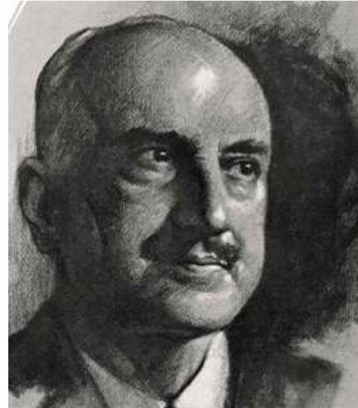
Figura. Retrato de Jorge Santayana (1863 – 1952).

academic life in America and Europe. The main elements of his philosophy are permeated by transfers, by the movement of ideas and intellectual perspectives across different speculative spectrums. The philosophical and existential figure of Santayana can indeed be defined as a frontier in itself, an area that encompassed seemingly opposing traditions and perspectives on life and thought: materialism and spiritualism, Spanish and English, academia and philosophical life, existence and essence, Europe and America. This text offers an overview of Santayana's life and work from the perspective that the best way to define them is as a frontier between supposedly contrary identities.