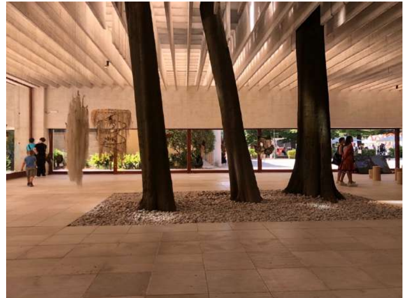
Figura. Pabellón Nórdico. Bienal de Venecia (2022).

Ultimately, this study argues that the Venice Biennale and documenta function not merely as recurring exhibitions, but as agents of cultural translation, institutional critique, and artistic diplomacy, reshaping the symbolic and political cartographies of contemporary art in an era of intensified global interconnectivity.