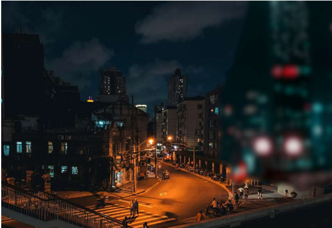
Figura. Representación del paisaje urbano de La ciudad y la ciudad, con parte del paisaje visible y parte desvisto. Elaboración propia a partir de imágenes de Yuhao Dan y de Irina Iriser, obtenidas en Unsplash por el autor.